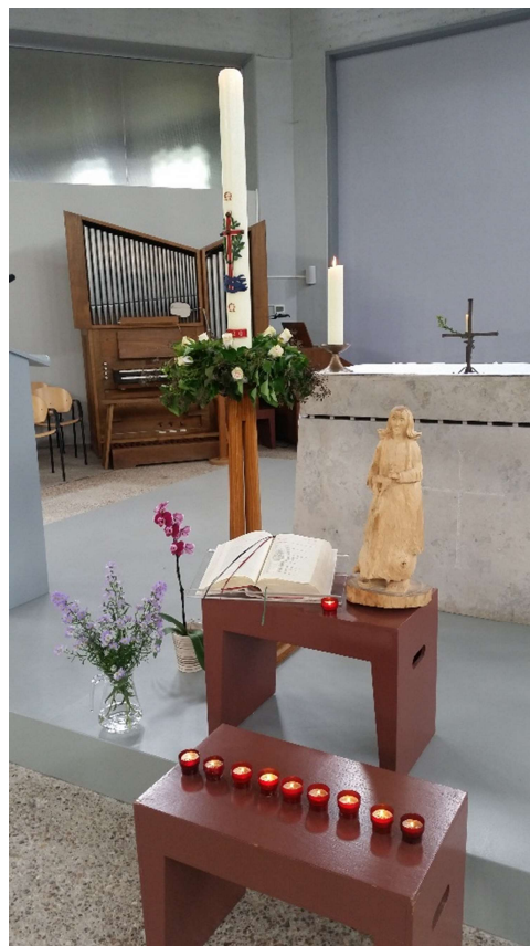
De Paaskaars in de kerk te Terneuzen.

Jezus leeft, wees maar niet bang, zijn liefde is sterker dan alle duisternis en dood.