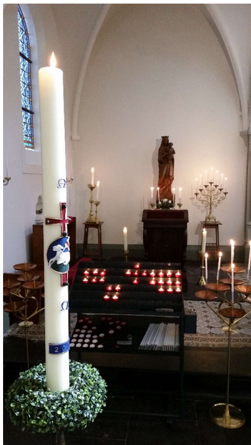
De Paaskaars in de kerk te Zuiddorpe.